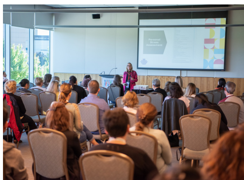
Un membre de l'Institut national de la paie effectue un apprentissage essentiel au cours de l'une des 42 séances de formation offertes lors du congrès annuel en présentiel.