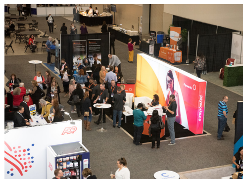
À l'occasion d'un salon professionnel en plein essor, des membres et des acteurs clés du secteur de la paie entretiennent des échanges fructueux.